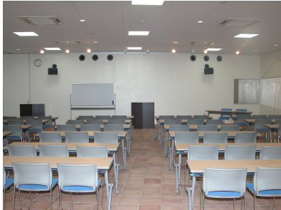
ホール スクール式

※スクール形式で着座できる最大人数は 120 名です。n ※使用料の割引 ϕ 連続して 7 日(1 週間)以上の使用…料金の 25%割引