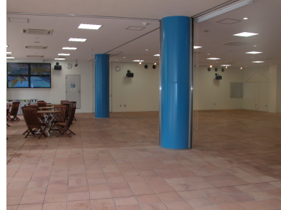
ホール 一服処含む