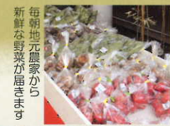
毎朝地元農家から 新鮮な野菜が届きます

店内は『おやまブランド』をはじめ 地場ものの様々な商品や農産物の 販売とご紹介をしております