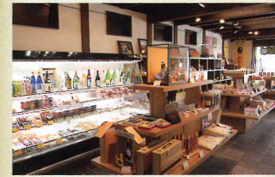
店内でお買い上げいただいた商品も こちらでお召し上がりいただけます